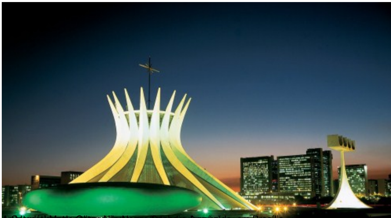
A Catedral Metropolitana de Nossa Senhora Aparecida, em Brasília, uma das obras mais